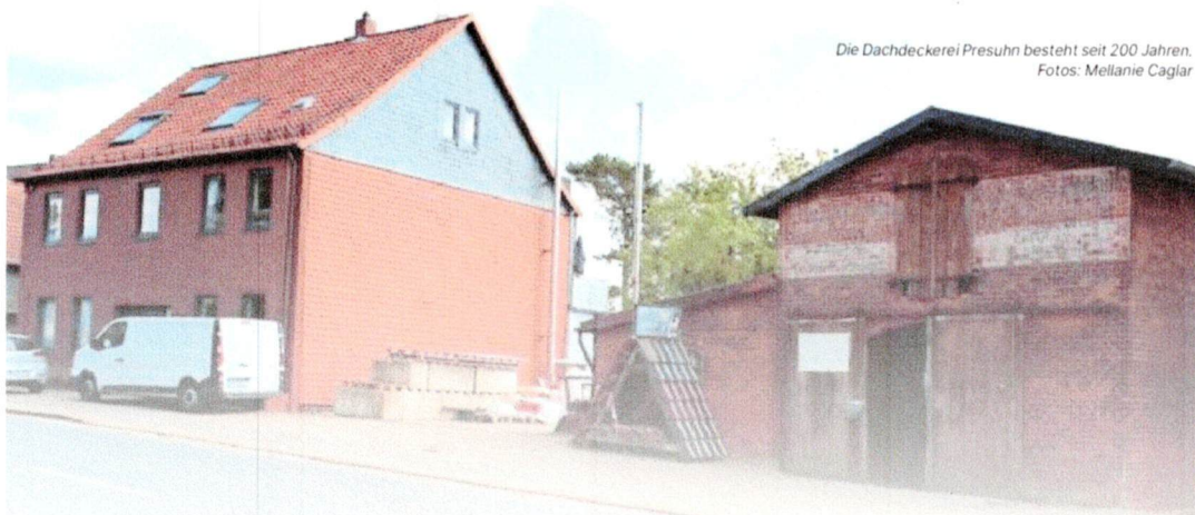
Die Dachdeckerei Presuhn besteht seit 200 Jahren.